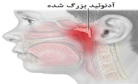
شکل ۲: محل آدنوئیدها